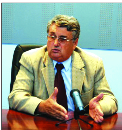
din cheltuielile consumatorilor.

“Se va evalua situația consumatorilor de energie termică pe fiecare scară de bloc în parte și dacă la data începerii furnizării acesteia există fie și doar un singur beneficiar rău platnic, nimeni nu va primi căldură”, a precizat edilul municipiului, subliniind faptul că administrația locală nu mai dispune de fonduri pentru subvenționarea prețului gigacaloriei. Și asta fiindcă are în subordine o serie de instituții precum spitalele, școlile și alte unități subordonate pentru care primăria suportă în întregime costurile. Mai mult, această formă de ajutor nu este în niciun fel agreată de Comunitatea Europeană, care recomandă investiții în eficientizarea întregului sistem și nu acoperirea unei părți